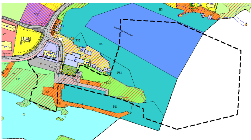
Utsnitt frå områdereguleringsplan for Sørbøvåg med forslag til planavgrensing.